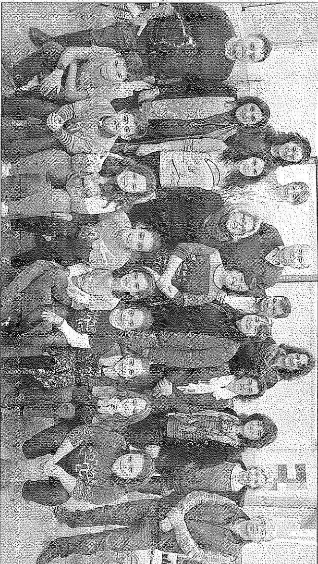
Los participantes en el taller práctico de Soundcool celebrado hace unos días en Alcàsser.

El objetivo del programa es desarrollar las competencias de los 3.000 alumnos participantes, de entre 6 y 12 años y procedentes de diferentes países y entornos socioeconómicos, a través de «actividades interdisciplinarias de cre-