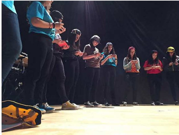
Alumnes de l'IES Arabista Ribera de Carcaixent durant un concert

Les eines d'avaluació dels resultats del projecte inclouen indicadors de qualitat, qüestionaris, observació i taules comparatives de resultats acadèmics en cursos anteriors.